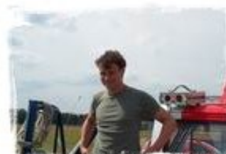
Allgemeine Organisation Flugbetrieb