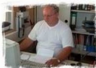
Allgemeine Organisation Anmeldung